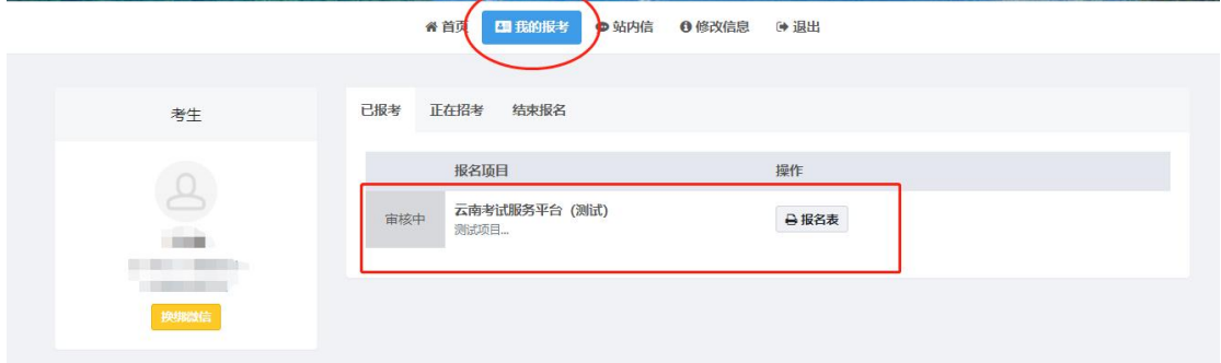
(图例：考生提交成功，须等待审核员审核)