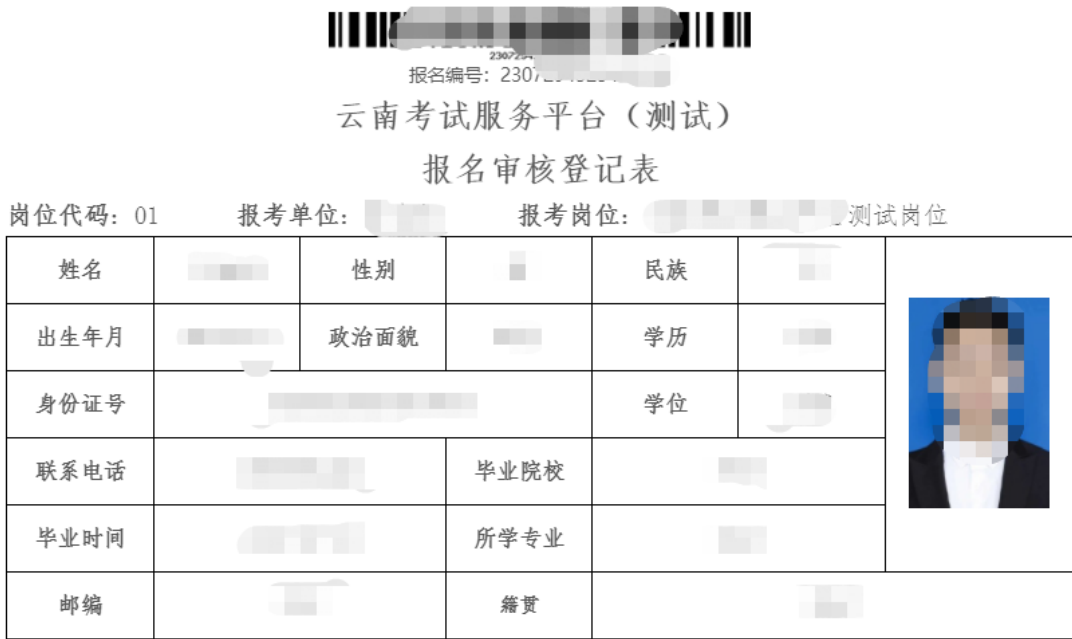
(图例：考生查看或打印自己的报名表)